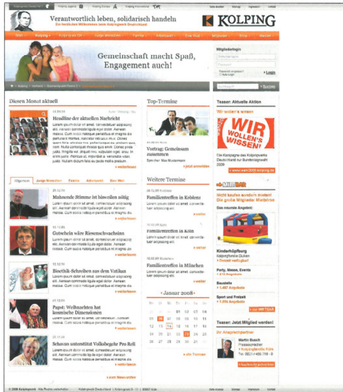
www.kolping.de – das Internetportal des Kolpingwerkes Deutschland

Gemeinsam mit GRÜN und der Agentur giftGRÜN hat das Kolpingwerk Deutschland jüngst sein Internetportal www.kolping.de relaunched und um eine leistungsfähige Community erweitert, die allen 270.000 Mitgliedern zur Verfügung steht. Vielfache Mehrwerte wie