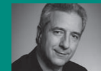
Stanislaw Tillich Ministerpräsident Sachsen, zum eVEWA-Einsatz nach der Flutkatastrophe in Sachsen

Mit GRÜN eVEWA können Sie nicht nur eine klassische Community für ihre Mitglieder aufbauen. Sie können auch z.B. Ihren Unterorganisationen direkten Online-Zugriff per Internet-Browser auf Teildatenbestände ermöglichen. Diese können dann die Daten der zentralen GRÜN eVEWA-Internet-Datenbank erfassen, verändern oder für eigene Zwecke downloaden.