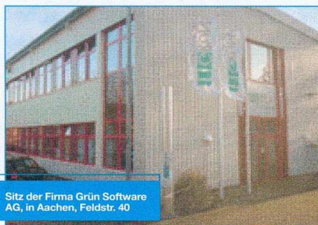
Sitz der Firma Grün Software AG, in Aachen, Feldstr. 40

Die Lieferung der Aachener Pakete ist mit Service wie Workshops, Datenübernahmen aus Altsystemen, Schulungen, Einführungsunterstützung und Wartungsleistungen verbunden. In einem getrennten Geschäftsbereich werden unabhängige Software-Beratungen und Dienstleistungen angeboten. ■